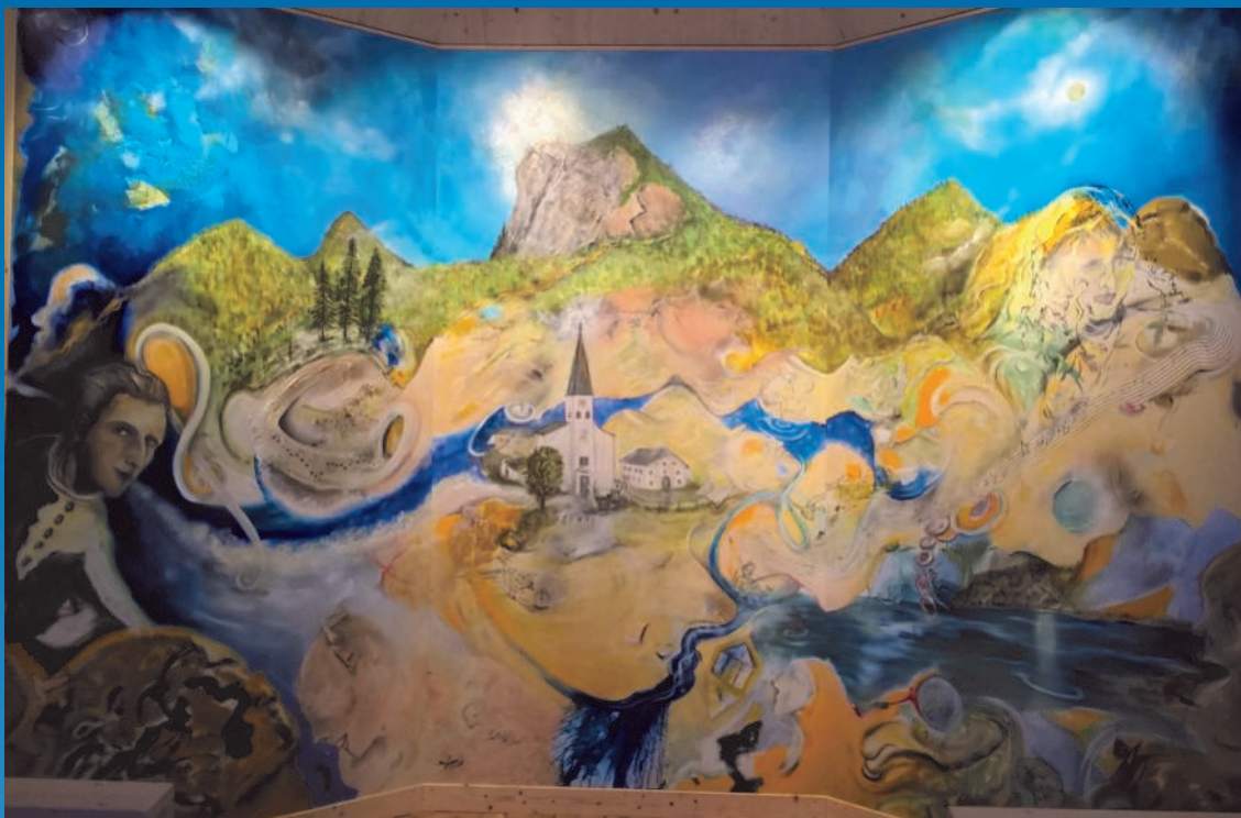
Hauptbild in der Joseph Mohr Kapelle Hintersee von Bernd Horak